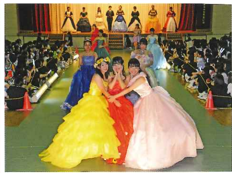
9月 ファッションショー