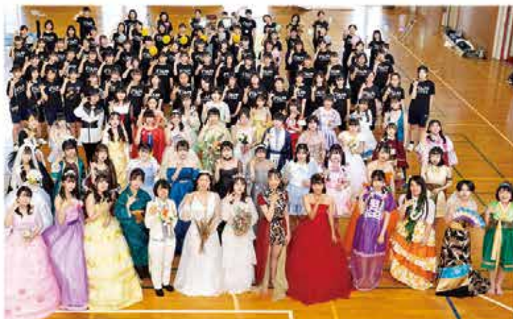
ファッションショー記念写真