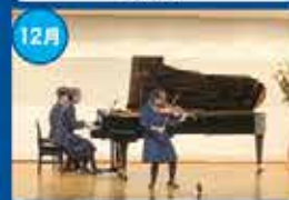
音楽科卒業演奏会