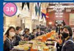
ブリティッシュヒルズ