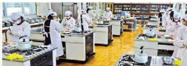
コロナ禍の調理実習