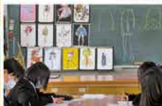
ファッション画講習会