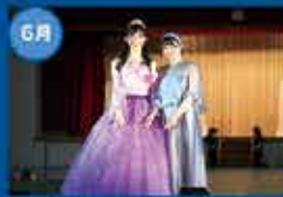
家政科ファッションショー