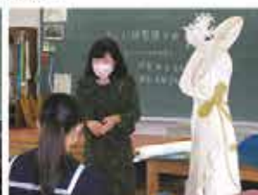
ドレス縫製講習会