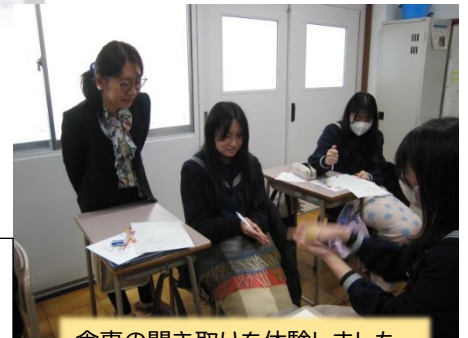
食事の聞き取りを体験しました