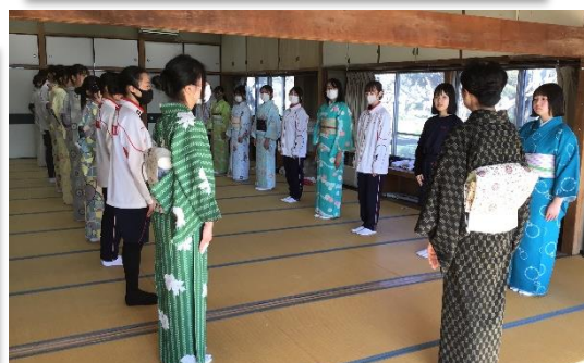
着付けの後には立礼(お辞儀)の作法