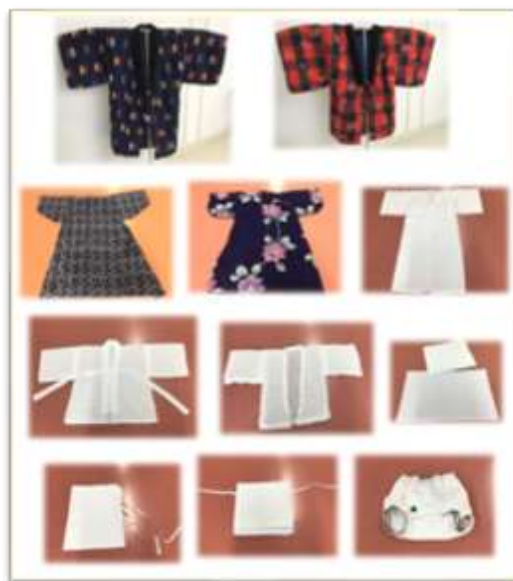
いろいろな製作品

・新しいことに挑戦する意欲や積極性や普段関わることのない人たちとの会話術、相手に分かりやすく楽しく伝える工夫をすることなど普段の生活だけでは身に付けられないことを学びました。 ・年齢にあわせて教え方を変えたり、話をしながら教えたりとわかりやすく教えるのは、難しいなと感じた。でも、教えていくうちに自分も教えてもらったり、話しかけてくれたりしたので、だんだんと緊張が解け、楽しくできた。