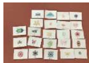
背守り刺しゅうの見本

背守りについて研究した内容を発表しました。 その後ワークショップで講師を務めました。