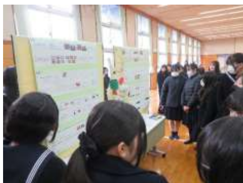
スライド発表や 展示発表に興味津々の下級 生たちです。