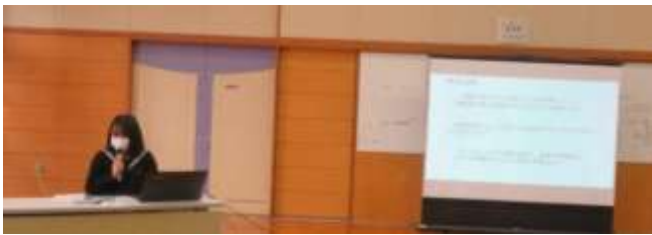
スライドによる発表者は6名です