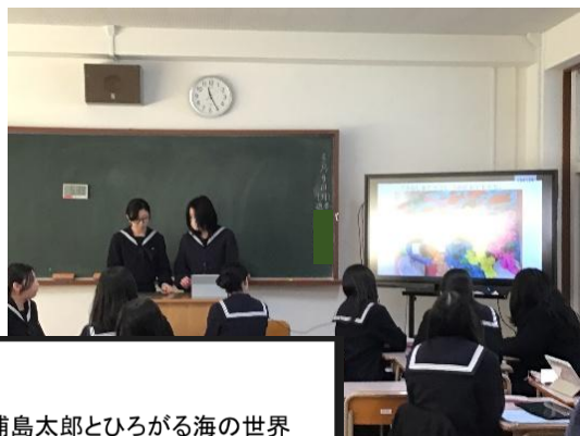
浦島太郎とひろがる海の世界 ～子どもの想像力を育てる壁面構成～