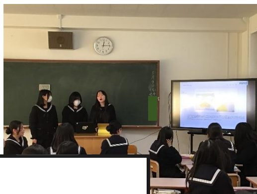
こどもの日の壁面に込めた思い ～保育環境における壁面装飾の役割とその工夫～